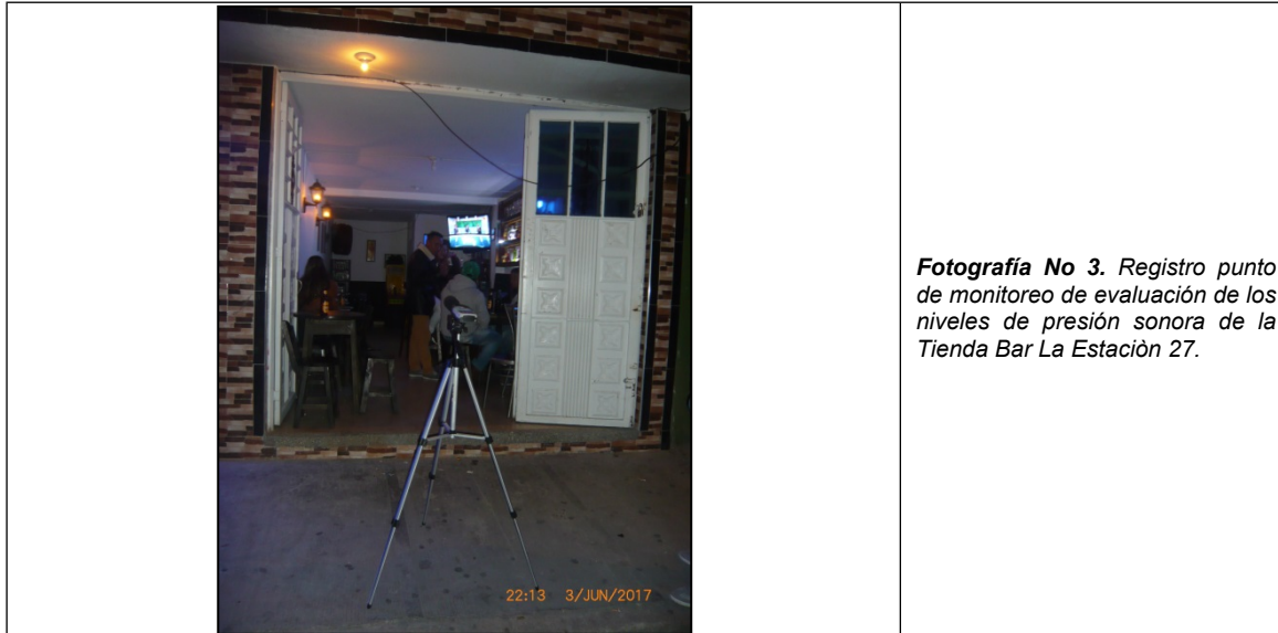
Fotografía No 3. Registro punto de monitoreo de evaluación de los niveles de presión sonora de la Tienda Bar La Estación 27.